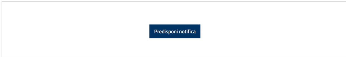
Fig. 2: predisponi notifica

La funzione in uso consente di predisporre la notifica mediante inserimento dell'atto da notificare, dalla ricevuta di mancata consegna, della relata di notifica e di eventuali ulteriori allegati.