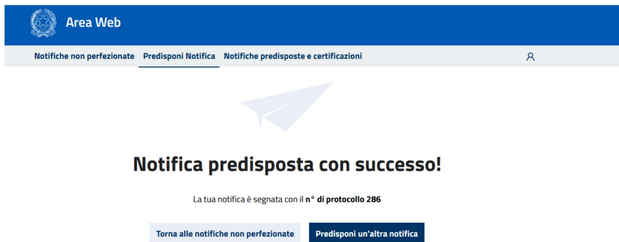
Fig. 7: esito creazione notifica

Una volta confermato verrà visualizzato l'esito dell'operazione con anche l'indicazione del numero di protocollo associato alla notifica creata. Si precisa che il numero di protocollo è un identificativo univoco all'interno del Portale.